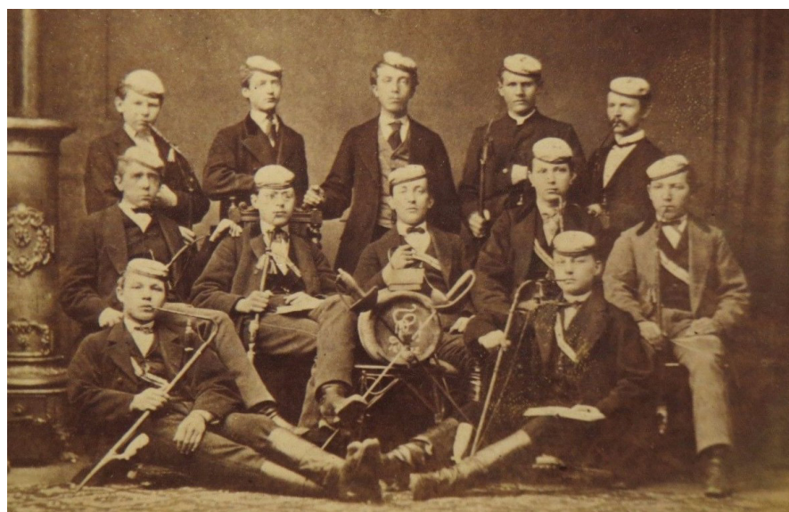
Afb. 1. Foto van groep studenten uit Bielefeld, eind 19e eeuw.

Bovengenoemde studentenpijpen zijn in drie hoofdgroepen te verdelen die afzonderlijk behandeld worden. Met extra aandacht voor twee bijzondere pijpen. Alle drie de groepen zijn even indrukwekkend en interessant, misschien wel mede omdat ze geen enkele overeenkomst in de soort afbeeldingen hebben die daarop gebruikt werden. De drie hoofdgroepen zijn als volgt samengesteld, als eerste de pijpen met de voorstelling van een in silhouet afgebeelde student. Als tweede de heraldische wapenpijpen en als derde en tevens ook grootste groep, pijpen met een allegorische voorstelling. Hieronder vallen ook de zeer mooie handbeschilderde pijpen met een gekalligrafeerd monogram. Vaak werd op de achterzijde de naam van de student (gever) en de datum of jaartal en plaats vermeld. Het jaartal werd