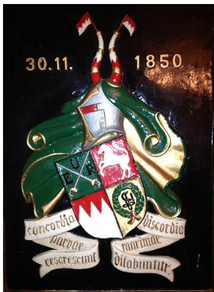
Afb. 12. Wapen Corps Franconia, Berlijn.

Aan de bierfeesten gaat een lange geschiedenis vooraf die terug gaat tot in de eerste helft van de 16e eeuw. Natuurlijk toen nog niet met het roken verbonden, maar