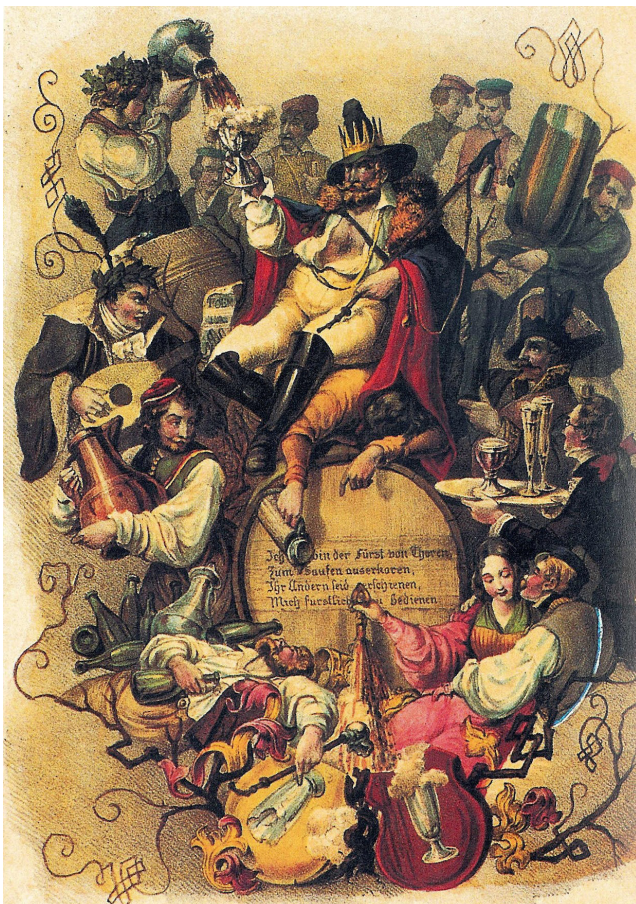
Afb. 14. 'Fürst von Thoren', Lithografie J. F. Lentner, circa 1848.

het waren al wel carnaval achtige feesten die meerdere dagen konden duren en met overvloedig drankgebruik gepaard gingen. Een mooi voorbeeld hiervan is het 'Papstspiel'. 13 De vroegste beschrijving hiervan waarbij de tabak al een belangrijke plaats innam stamt uit 1644. Nadat de wedstrijd wie het meest gedronken had een winnaar kende, werd die met de hoogste eer tot 'Papst' gekroond. Het daarop volgende ritueel was het veelvuldig uitblazen van tabaksrook over de nieuw gekozen 'Papst' totdat die bewusteloos wegzakte. Het algemeen geaccepteerde pijproken bij deze uitbundige feesten ontstond pas in de eerste helft van de 19e eeuw. Deze feesten vonden vooral plaats in Jena, Leipzig en Breslau. Maar zeker ook in de vele omliggende steden. De drankgelagen hadden veelzeggende namen als 'Fürst von Thorn' of eerder genoemde 'Papstspiel'. Bij het hedendaagse carnaval is ook sprake van een prins die tijdens een aantal dagen de baas is. Dit is ook zo bij de bierfeesten en er wordt dan een 'Fürst' (vorst) gekozen. Vooral bij de bierfeesten wordt met alles en iedereen de spot gedreven en dat komt uit in de voordrachten en de verzen die de studenten dan voordroegen en zongen. Een mooi voorbeeld van een pijp die de hele geschiedenis van een bierfeest weergeeft is de pijp met 'Der Fürst von Thorn' (afb. 13).