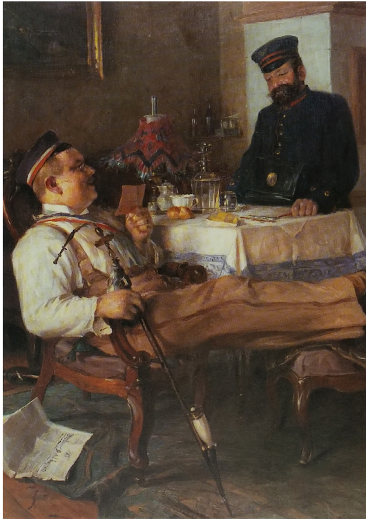
Afb. 3. Rokende student. (Collectie Postmuseum Frankfurt am Main).

soms ook nog extra op het spoor aan de voorzijde vermeld. Het kwam ook voor dat de student een spreuk of een door hem zelf opgegeven tekst op de achterzijde liet schrijven. De voorzijde is een enkele keer voorzien van een Latijnse spreuk. Dit is vooral bij de wapenpijpen het geval. De vorm van de pijp is meestal een 'stummel' maar ook werd een type pijp waarvan de kop met de vochtzak één geheel vormt gebruikt, zei het in duidelijk mindere mate. Men noemde dit het zwanenhals model. 5