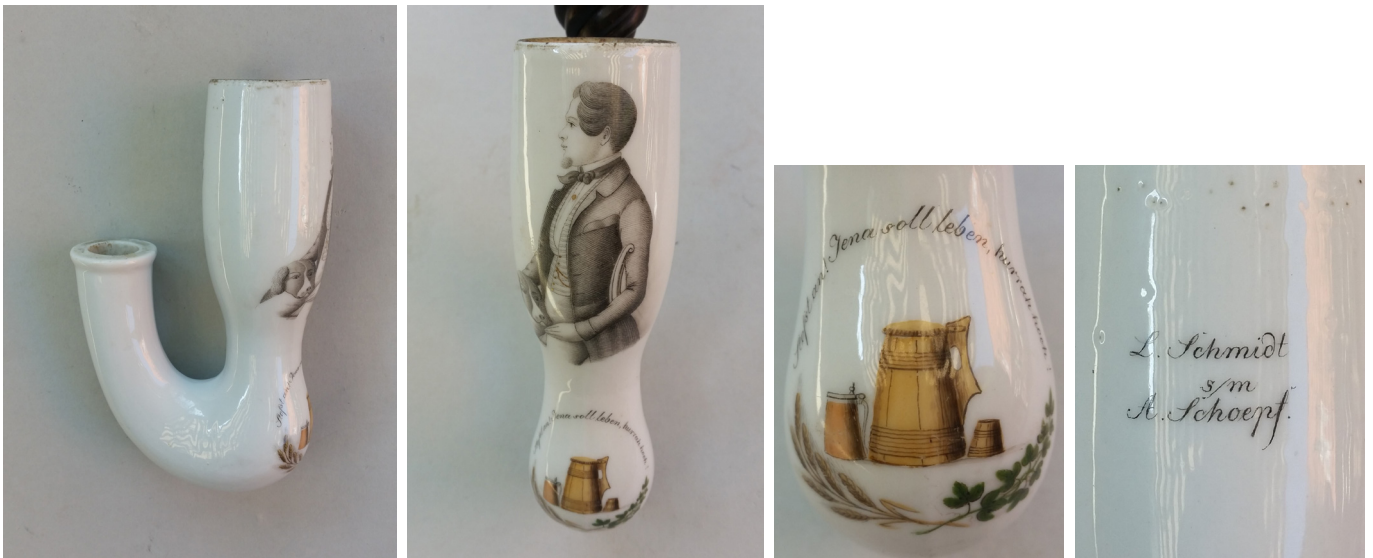
Afb. 6a-d. Studentenpijp met zwanenhals model, afbeelding en tekst fijn handgeschilderd. Hoogte 14,5 cm., breedte 4,5 cm. (Collectie auteur).

studentenkorps beschilderd. 7 Als de student daarbij ook een sjerp/band draagt is die met dezelfde kleuren van het korps versierd. Kenmerkend zijn de kalotten en de grote verscheidenheid aan mutsen die typisch bij de studentenkleiding behoorden.