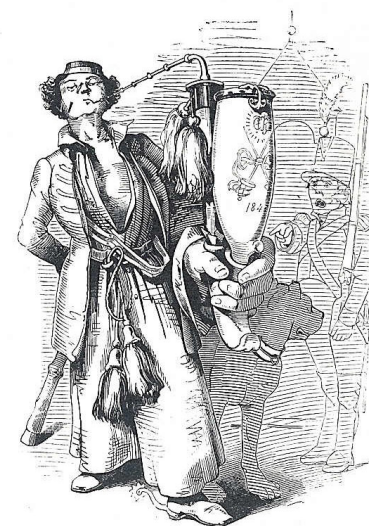
Afb. 2. Karikaturale afbeelding van een 'Bursch', Anoniem, 1845.