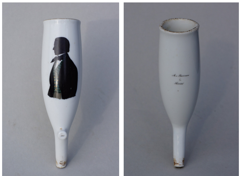
Afb. 5a-b. Studentenpijp met uitlopende ketelrand, afbeelding en tekst handgeschilderd met kleuraccenten, gedateerd op hiel 1845. Hoogte 14 cm., ketelopening 3,5 cm. (Collectie auteur).