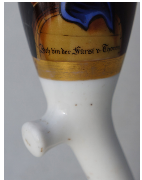
Afb. 13a-b. Allegorische pijp, ‘Ich bin der Fürst v Thoren’, volledig handgeschilderd in een gouden kader, datering circa 1850. Hoogte 15 cm., doorsnede ketel opening 3,5 cm.