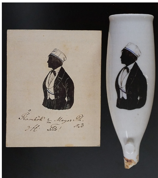
Afb. 4. Silhouet en pijpenkop met portret van de Beierse 'Fuchs' Karl Pramböck, circa 1847 (Uit: Niehoff, 1997, p. 75, Kat. Nr. 46).

De silhouet pijp is de minst opvallende soort pijp, maar heeft een prachtig ingetogen sobere stijl. Dit in tegenstelling tot de twee andere typen studentpijpen die zeer uitbundig van voorstelling en kleurgebruik zijn. Een ander verschil is dat de twee andere typen al bekend waren vanaf het eerste kwart van de 19e eeuw. De silhouetpijp echter is maar zeer kort in gebruik geweest. Rond 1845 verschenen de eerste silhouetpijpen. Toen de mogelijkheid zich voordeed om een foto als afbeelding in plaats van een gravure te gebruiken luidde dit het einde van de silhouetpijp in. Dit was rond 1865, al circa 20 jaar nadat de eerste silhouetpijpen op de markt kwamen. Op de silhouetpijp werd de student als borstbeeld 'en profiel' (afb. 4) afgebeeld. Soms volledig in het zwart maar soms werden vest en kalot (muts) minutieus met de verschillende kleuren van het